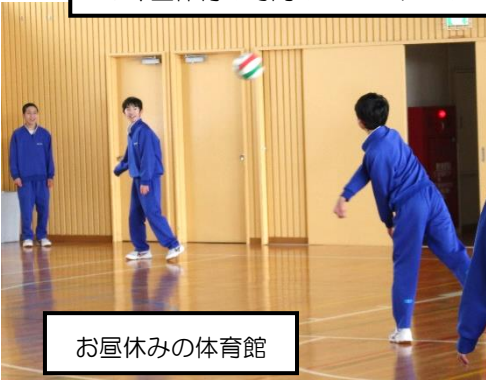
お昼休みの体育館