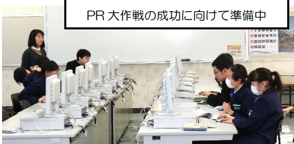
PR大作戦の成功に向けて準備中

当日は、同会場で、新発田オイスターバー実行委員会主催の「牡蠣（かき）のふるまい」イベントが開催されています。1年生の活動を応援していただくとともに、兵庫県赤穂特産の牡蠣の振る舞い（蒸し牡蠣 1000個が無料で振る舞われます）も楽しみに、ぜひ会場に足をお運びください。