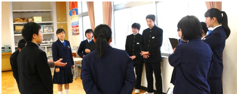
生徒朝会終了後に生徒会役員や専門委員長らが輪になって、振り返りの話し合い

広報委員会の12月の主な活動は、図書室の開放、本の貸し出し、昼の放送、掃除のBGMでした。良かった点は図書室をすぐに開けられたこと、掃除のBGMを忘れなかったことです。改善点は、生徒会誌「あしあと」の原稿の依頼が遅れてしまったので、来年は遅れないように、前もって準備をしてください。1月、2月の活動は「あしあと」の原稿回収でした。全校のみなさん、「あしあと」の原稿を書いたみなさん、ありがとうございました。