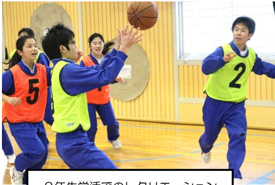
2年生学活でのレクリエーション