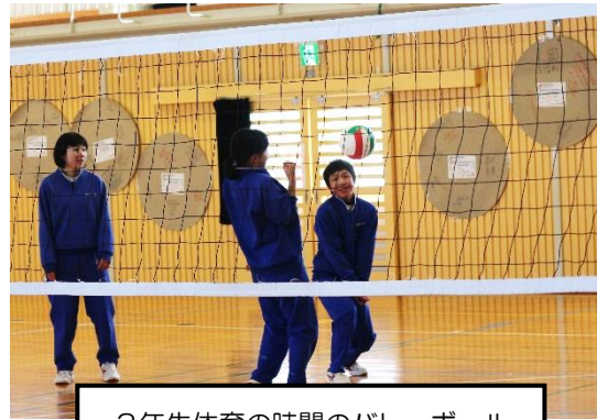
3年生体育の時間のバレーボール